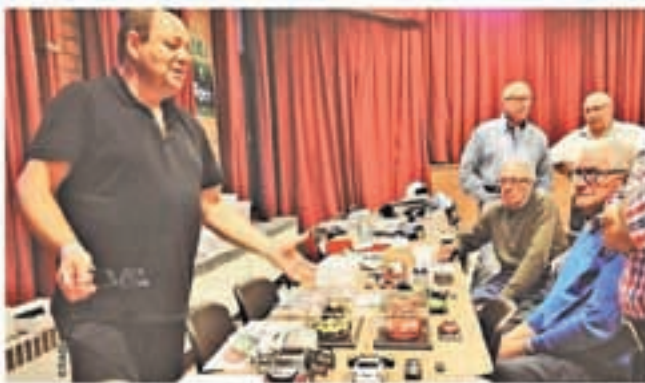
Deze foto modelbouwer toont zijn nieuwe creaties tijdens de 'Artevelde Challenge'.