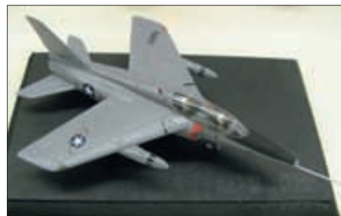
▶ RECHTS DE "HOT SHOT'S" FOLLAND GNAT T1.