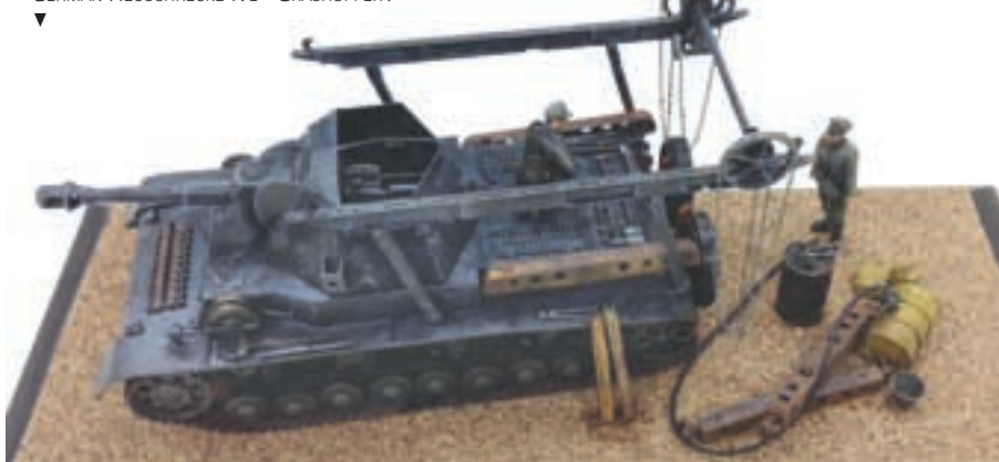
J.P. TOONDE ONS EEN NIET-ALLEDAGSE 1/35 SETTING. HET BETROF EEN GERMAN HEUSCHRECKE IVb "GRASHOPPER".