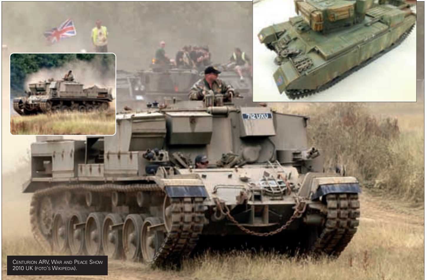
CENTURION ARV, WAR AND PEACE SHOW 2010 UK.