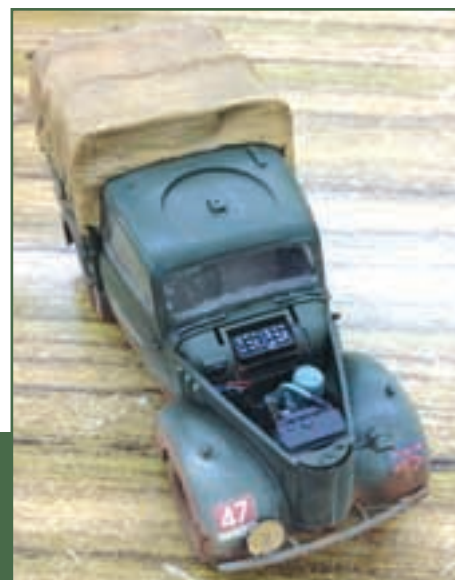
DEZE BRITISH LIGHT UTILITY CAR 10HP AUSTIN 'TILLY' VAN PETER HAD U NOG TE GOED. GEZIEN OP DE SEPTEMBERTAFELS. SCHAAL 1/48.