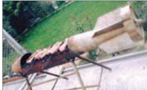
◀ BRON ONBEKEND, MAAR HET HEEFT GESMAAKT.