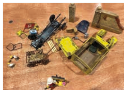
◀ MARC ZETTE ZICHZELF APART IN DE KIJKER DOOR HEEL WAT RECUPEREERBARE MODELONDERDELEN DOOR DE MANGEL TE DRAAIEN. HIER ZIT WEDEROM IETS SPECIAALS AAN TE KOMEN. WORDT VERVOLGD.

Veel plezier met deze februari-aflevering vol modelbouwwerkzaamheden.