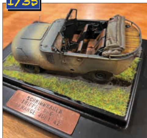
▲ FREDDY VERVOLMAAKTE ZIJN ORIGINELE SCHWIMMAGEN TRIPEL SG6/38. KLAAR OM BEWONDERD TE WORDEN.