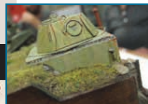
ONS COVERMODEL VOOR JANUARI IS HET SCHITTEREND DIORAMA VAN SWA